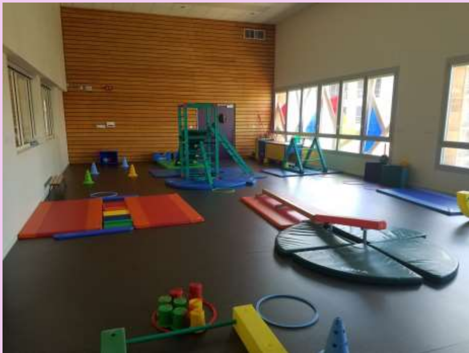
Salle de motricité