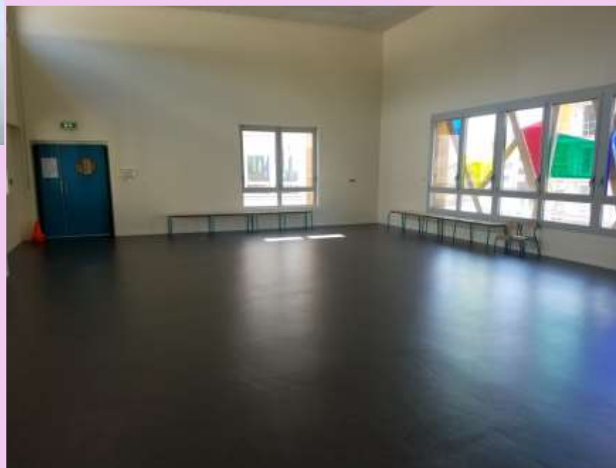
Salle d'activités et de siestes